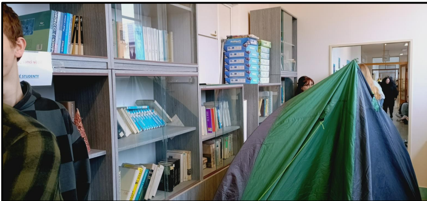
Konec zábavám ve studovně. Na snímku stan jako náhrada tašky ve dni bez tašek

V kanceláři proběhne rekonstrukce, a tak se na nějaký čas přesune do studovny. A kam se přestěhuje studovna? Nikam. Pokud čekáte na vyučování, či na autobus, musíte si sednout na gauče vyndané před studovnu. Není to sic pohodlné, ale co se dá dělat. Nějak to přečkat musíme.