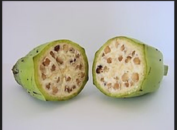
Řez divokým banánem

Banánovník ovocný je vytrvalá bylina, i když to není strom, dosahuje výšky až 10 m. Banánovníkové plantáže se nacházejí v tropických oblastech, kde průměrná roční teplota je vyšší než 20 °C a průměr ročních srážek je asi 2000 mm. Rostliny vyžadují velké množství vody. Jejich žluté a sladké plody „banány“ jsou velice žádaným zbožím.